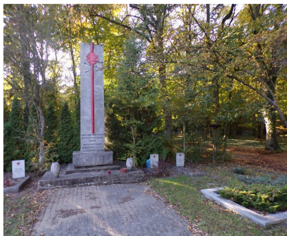
Братская могила в Польше.