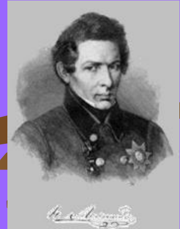
3. Николай Иванович Лобачевский

2). «Математика – царица наук, арифметика – царица математики»