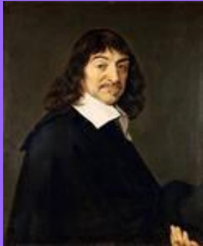
1. Рене Декарт