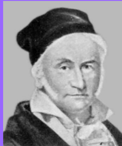
2. Карл Фридрих Гаусс