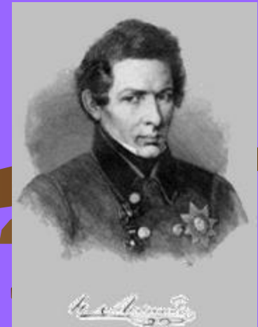
3. Николай Иванович Лобачевский

3. Мало иметь хороший ум, главное – хорошо его применять.